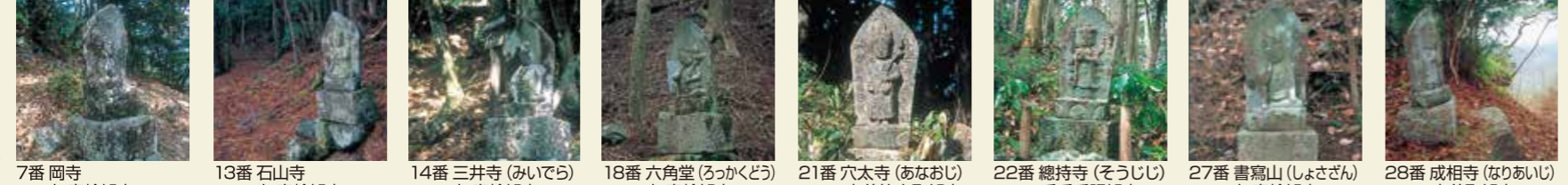
7番 岡寺 如意輪観音 13番 石山寺 如意輪観音 14番 三井寺 (みいでら) 如意輪観音 18番 六角堂 (ろっかくどう) 如意輪観音 21番 穴太寺 (あなおし) 本尊等身聖観音 22番 總持寺 (そうじ) 千手千眼観音 27番 書寫山 (しよざん) 如意輪観音 28番 成相寺 (なりあいし) 本尊聖観音