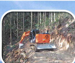
作業道開設・修繕 - 木材搬出のための道づくり -