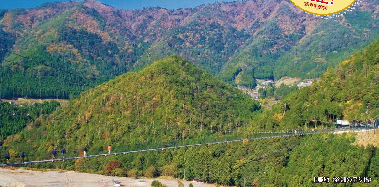
上野地 (谷瀬の吊り橋)